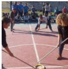
Deportes alternativos, una ...