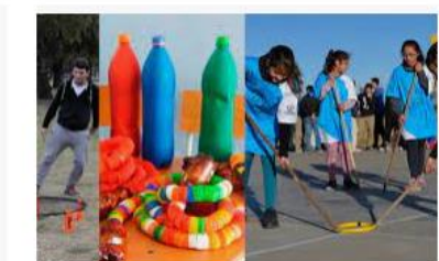
Deportes alternativos para pasar la cuarentena jujuyalmomento.com