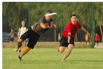
Deporte Alternativo - EcuRed ecured.cu