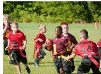
La llegada de los deportes alternativos ... auca.es