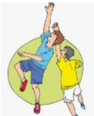
Deportes y juegos alter... abc.com.py