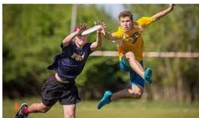
Qué son los deportes alternativos? elcierredigital.com

Tema: Deportes Alternativos: Los Deportes Alternativos son actividades que podemos utilizar como un medio para alcanzar un correcto desarrollo motor, a través de la adquisición y perfeccionamiento de destrezas y habilidades instrumentales dentro de un contexto significativo de comportamiento humano